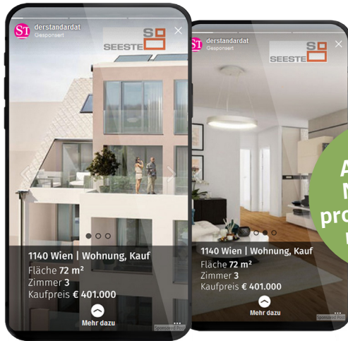
Instagram Stories Ad