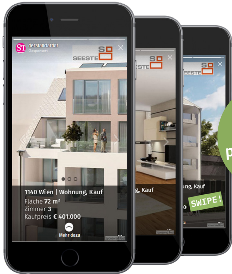
Instagram Stories Ad