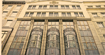
Wer sich einen Altbau mit erstklassiger Haustechnik mietet, ist ein Altbau, etwa an der hohen Adresse Färberbastei 1.

Zwar entstehen in Wien derzeit viele neue Büros, aber auch Büros im Altbau werden nachgefragt – besonders im ersten Bezirk. Wer sich einmietet, aber die Haustechnik eines Neubaus.