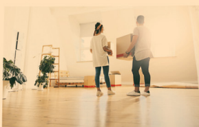
Zwei steht oft schon lange im Vorfeld der Umzugsfirma fest – auf die Suche nach einem Umzugsunternehmen legen sich viele Umzügler aber viel zu spät, kritisiert die Expertin.

Ein Umzug ist Stress pur. Das machen sich windige Umzugsfirmen zunutze, die mit Dumpingpreisen werben, am Umzugs tag aber plötzlich horrenden Summen verlangen. Die Fachgruppe ist sich über Vorzüge zu guter Recherche.