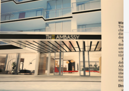
Der herrschaftliche Eingangsbereich von The Embassy. Im Foyer wird es für die Sommerhitze geheizt.