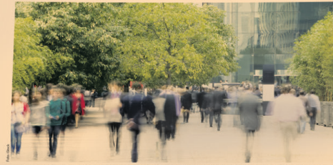
Das Thema Klimaschutz ist in der Branche bereits angekommen, sagen Experten. Oft fehlen aber noch wirtschaftlich vertretbare Lösungen.