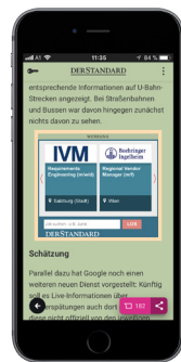
Skyscraper im redaktionellen Umfeld (Job-Sky)